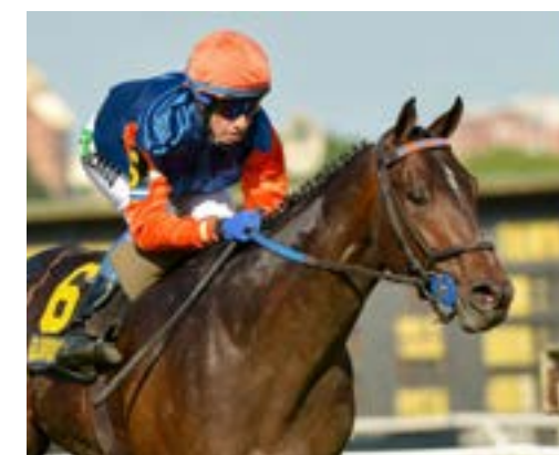
GLORIOUS MOMENT CLASICO PROVINCIA DE BUENOS AIRES (G3)

Es padre de MIRTA , ganadora de 2 carreras en San Isidro, incluso Gran Premio Enrique Acebal (G1), 2da Gran Premio Copa de Plata (G1), 3ra Gran Premio Selección (G1) GLORIOUS MOMENT , ganador de 2 carreras en san Isidro, incluso Clásico Provincia de Buenos Aires (G3). DANZARIN , ganador de 2 carreras en La Punta, incluso Clásico Ensayo y Clásico Juvenile. Fromm , ganador en San Isidro, 2do Clásico Prov de BsAs (G3) Lima Tango Alfa , 3ra Clásico Eliseo Ramírez (G2). Tigerbeach (USA-2015), ganador en USA. a los 2 años, 3ro. Victoria Stakes (USA-L). Seattle Treasure (USA-2015), ganador en USA. a los 2 años, 3ro. Juvenile Turf Stakes (USA). VENTAJERO SOY , ganador de 2 carreras en San Isidro, etc.